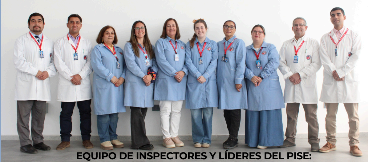
EQUIPO DE INSPECTORES Y LÍDERES DEL PISE: